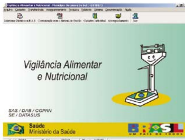
Figura 2 – Módulo vigilância alimentar e nutricional desenvolvido pelo Datasus

os usuários das unidades de atenção básica terem seu estado nutricional avaliado sistematicamente, o sistema suscita a incorporação de uma atitude de vigilância por parte dos profissionais de saúde.