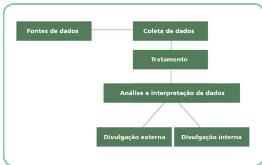
Figura 4 – Desenho básico do fluxo de dados do Sisvan no setor saúde

O esquema apresentado na Figura 3 se refere a uma proposta da Funasa para a organização do Sisvan Indígena. Para começar a compreender a dinâmica do fluxo de dados, observe o desenho básico em cada uma das etapas.