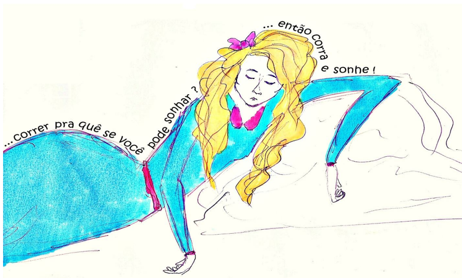
Jéssica Viegá. Sonhar . Técnica mista sobre papel A3, 2013.