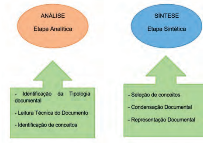
Figura 1 – Processo de análise documental